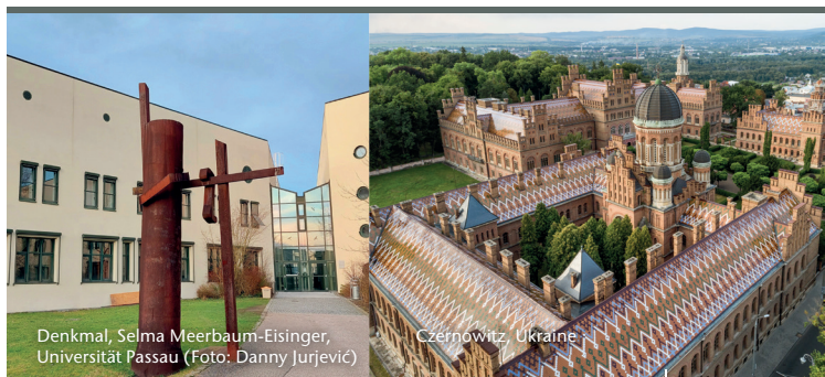
Denkmal, Selma Meerbaum-Eisinger, Universität Passau