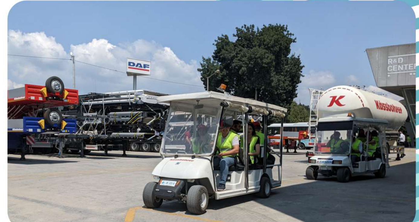
Führung durch die Adapazari Fabrik

Das Thema des Forschungsprojekts 2022 bei Tirsan/ Kässbohrer: "Creating a sustainable employer brand image"